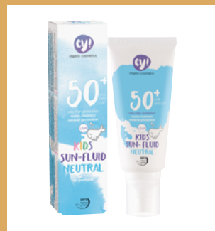
Kids Sun Fluid Neutral SPF 50+ de ey!