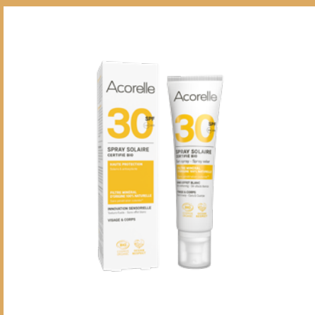
Spray Solar FPS 30 de Acorelle