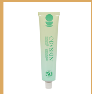
Sunscreen SPF 50 de ODYSKIN