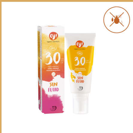
Sun Fluid SPF 30 de ey!