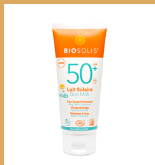
Leche Solar Kids Super Protection SPF50+ de Biosolis