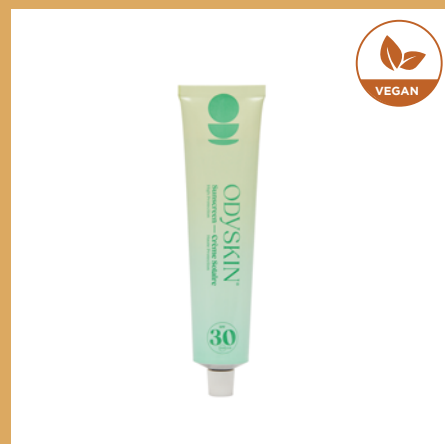
Sunscreen SPF 30 de ODYSKIN