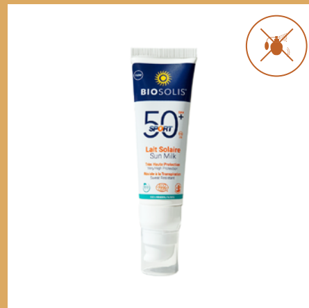
Leche Solar Sport FPS 50+ de Biosolis