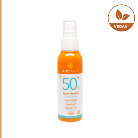
Spray Solar FPS 50 de Biosolis