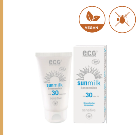
Leche Solar Sensitive FPS 30 de eco cosmetics