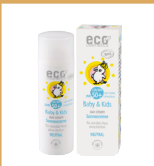
Crema Solar Baby & Kids Neutral SPF 50+ de eco cosmetics