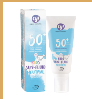
ey! Kids Sun Fluid Neutral SPF 50+